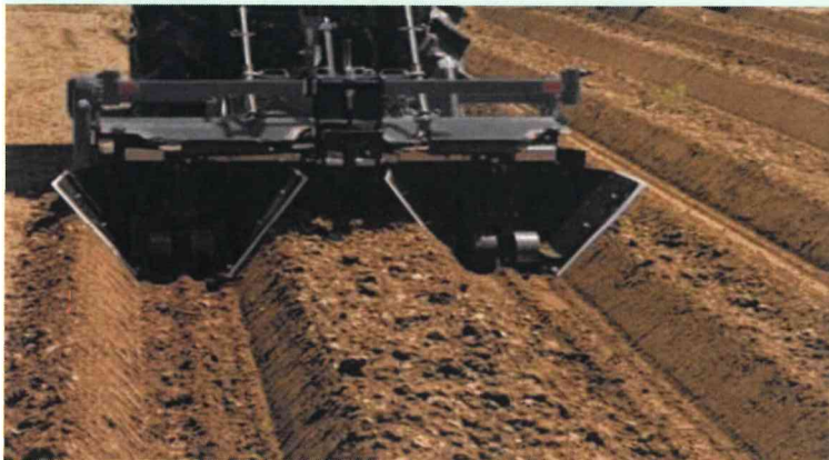
TAS-203による【谷あげ成形】作業